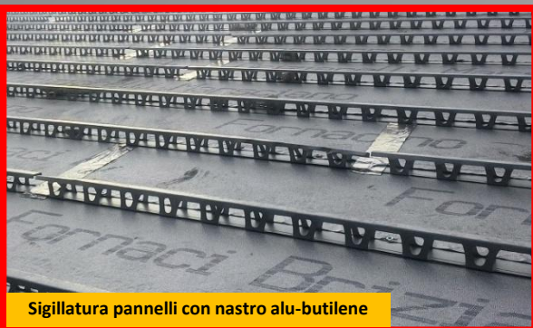
Sigillatura pannelli con nastro alu-butilene