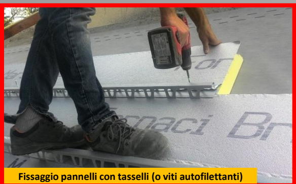
Fissaggio pannelli con tasselli (o viti autofilettanti)